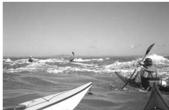
North Stack tide-race, Anglesey, Wales