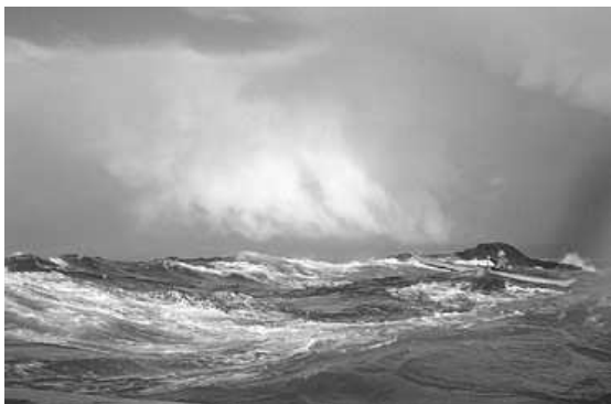
Penrhyn Mawr tide-race, Anglesey, Wales