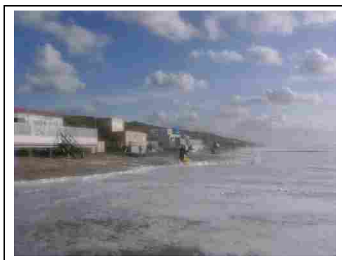
Branding op 4 oktober 2009

Drie jaar vaarplezier samenvatten op een blaadje papier – het valt niet mee. Ik zou een overzicht kunnen geven van stoere verhalen, maar dat zie ik toch niet echt zitten. Wie er bij was, weet ervan, en dat is voldoende. Wat voor mij echt telt is dat ik in het kanoën een hobby had gevonden waar ik mij echt kon in uitleven en in de KVVU had ik ook clubje mensen gevonden waar ik mij goed tussen voelde.