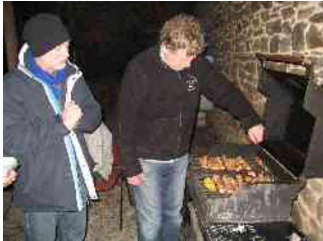
De avond wordt besloten met de barbecue.

Na veel keerwatertjes en valletjes waren de leden van KVV aan het eindpunt koud, nat en ingewijd in de geheimen van stromend water.